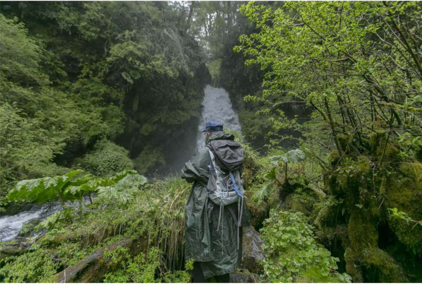
Bosque Pehuén - Región de la Araucanía, Chile